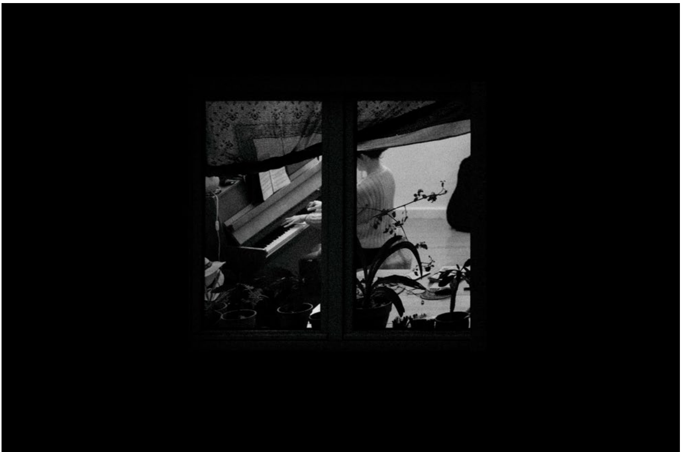
#7 | Berlin, 2018 | formato 45 x 30 cms | edición 7 + 2 A.P. firmada y numerada | impresión Fine Art sobre Hahnemühle Photo Rag ultra smooth 305 grs. 100% algodón | precio 80.000 CLP