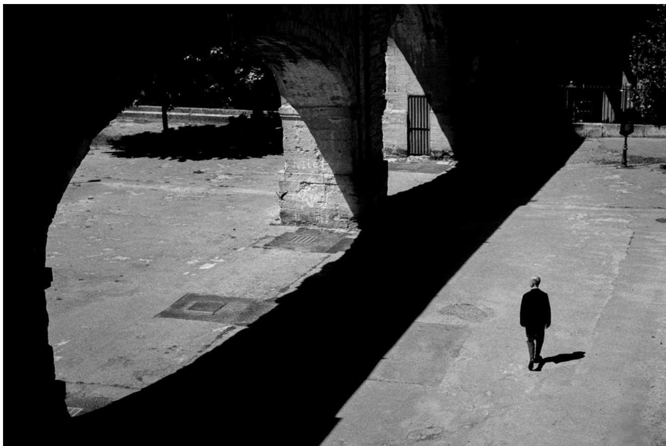
#3 | Montpellier, 2022 | formato 75 x 50 cms | edición 7 + 2 A.P. firmada y numerada | impresión Fine Art sobre Hahnemühle Photo Rag ultra smooth 305 grs. 100% algodón | precio 160.000 CLP | 6 disponibles