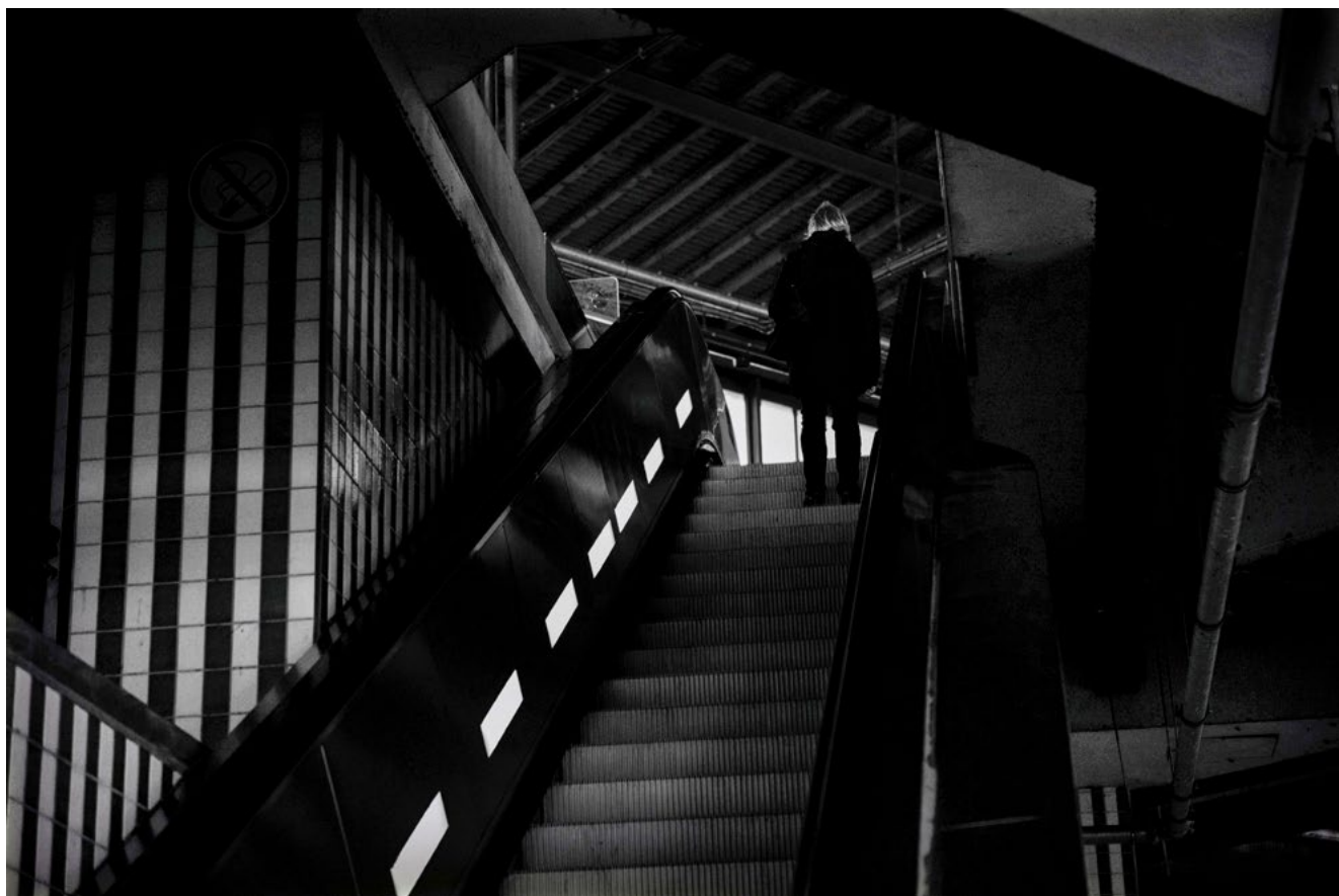
#18 | Berlin, 2018 | formato 30 x 21 cms | edición 7 + 2 A.P. firmada y numerada | impresión Fine Art sobre Hahnemühle Photo Rag ultra smooth 305 grs. 100% algodón | precio 70.000 CLP