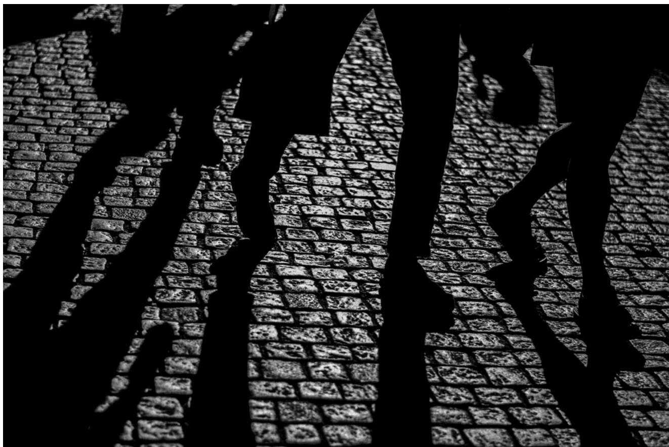
#11 | Stockholm, 2015 | formato 45 x 30 cms | edición 7 + 2 A.P. firmada y numerada | impresión Fine Art sobre Hahnemühle Photo Rag ultra smooth 305 grs. 100% algodón | precio 80.000 CLP