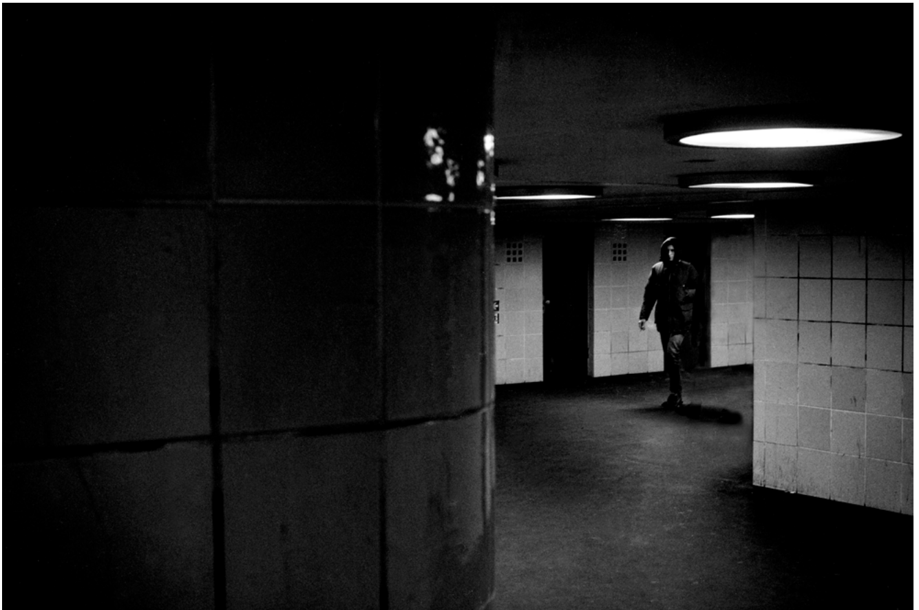
#16 | Berlin, 2023 | formato 45 x 30 cms | edición 7 + 2 A.P. firmada y numerada | impresión Fine Art sobre Hahnemühle Photo Rag ultra smooth 305 grs. 100% algodón | precio 80.000 CLP