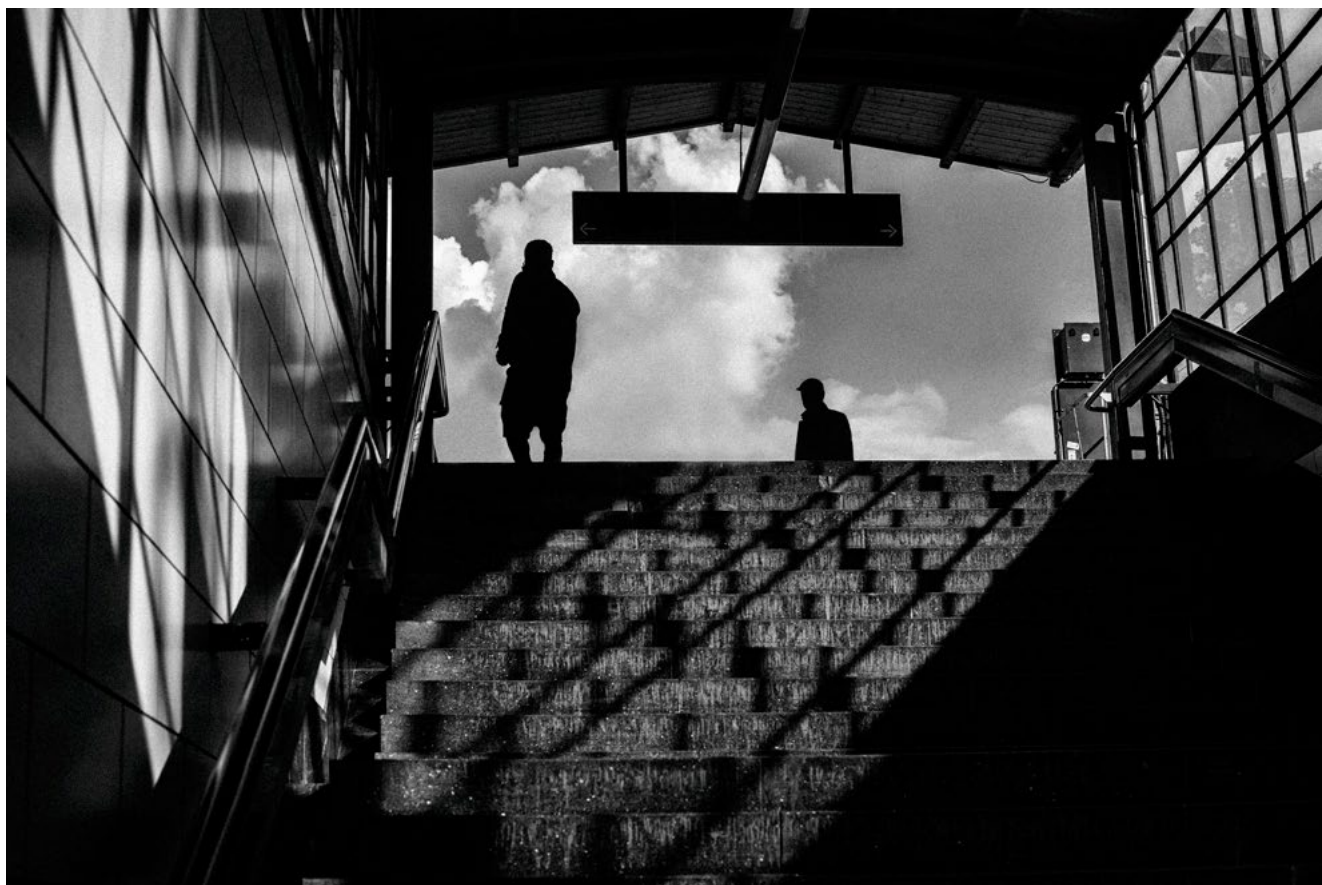
#1 | Berlin, 2019 | formato 75 x 50 cms | edición 7 + 2 A.P. firmada y numerada | impresión Fine Art sobre Hahnemühle Photo Rag ultra smooth 305 grs. 100% algodón | precio 160.000 CLP