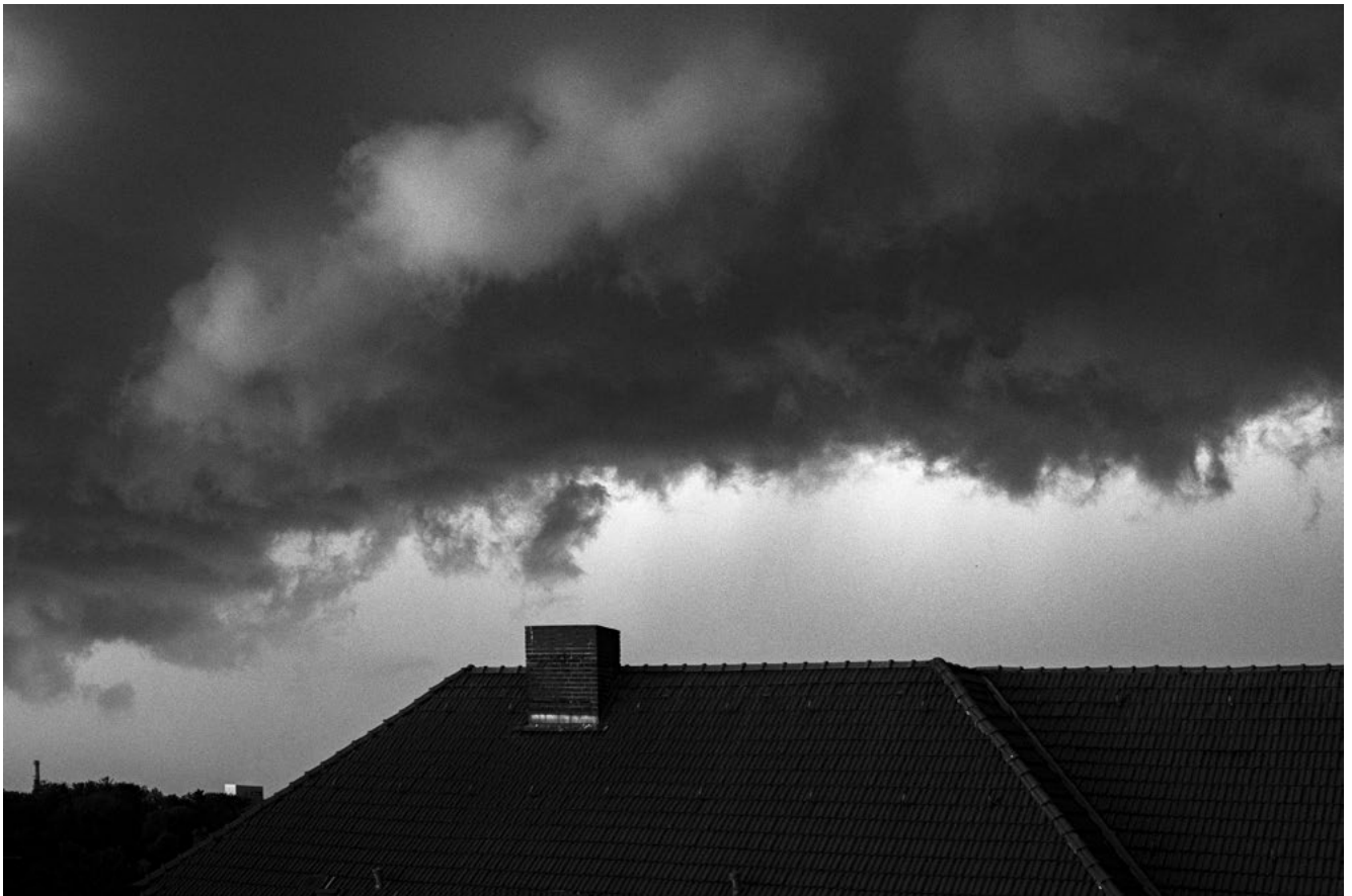
#4 | Berlin, 2023 | formato 45 x 30 cms | edición 7 + 2 A.P. firmada y numerada | impresión Fine Art sobre Hahnemühle Photo Rag ultra smooth 305 grs. 100% algodón | precio 80.000 CLP