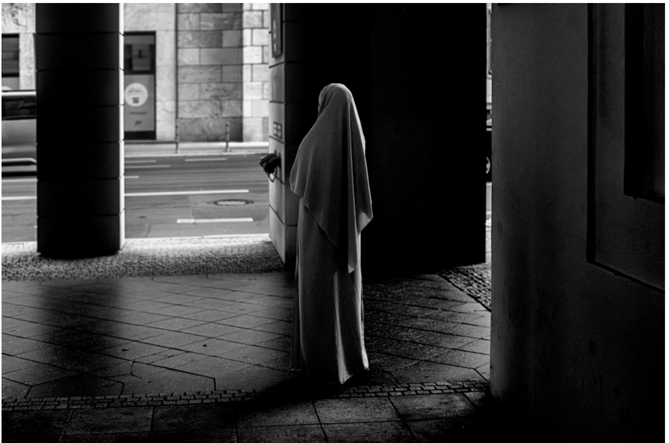
#15 | Berlin, 2023 | formato 45 x 30 cms | edición 7 + 2 A.P. firmada y numerada | impresión Fine Art sobre Hahnemühle Photo Rag ultra smooth 305 grs. 100% algodón | precio 80.000 CLP