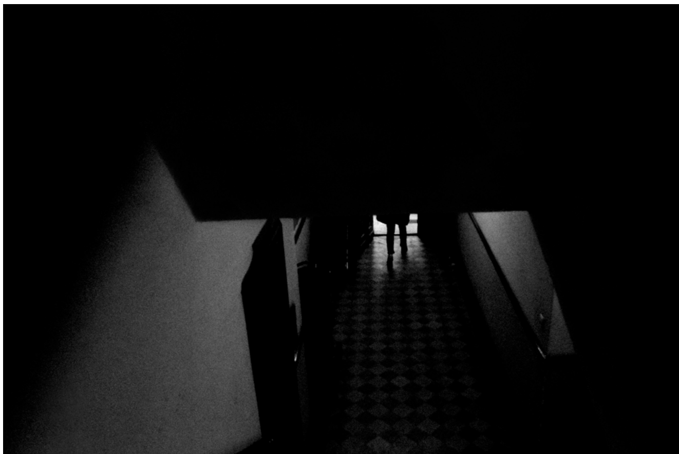
#19 | Berlin, 2017 | formato 30 x 21 cms | edición 7 + 2 A.P. firmada y numerada | impresión Fine Art sobre Hahnemühle Photo Rag ultra smooth 305 grs. 100% algodón | precio 70.000 CLP