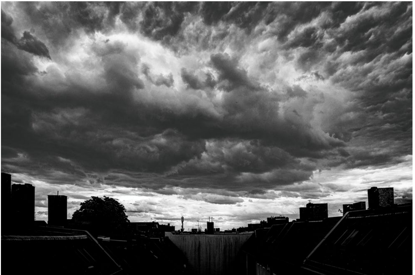
#12 | Berlin, 2024 | formato 45 x 30 cms | edición 7 + 2 A.P. firmada y numerada | impresión Fine Art sobre Hahnemühle Photo Rag ultra smooth 305 grs. 100% algodón | precio 80.000 CLP