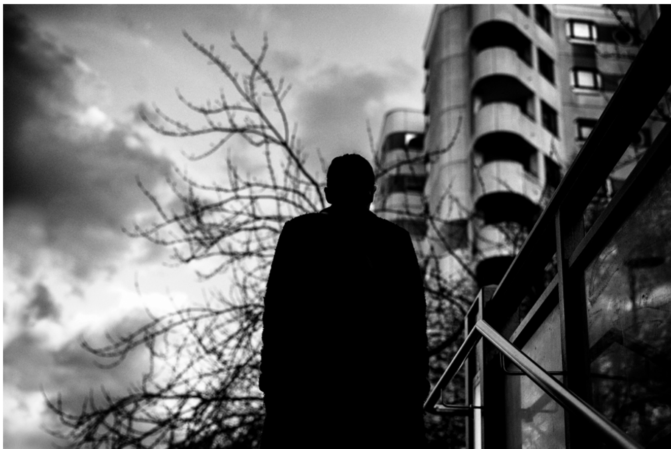
#2 | Berlin, 2023 | formato 75 x 50 cms | edición 7 + 2 A.P. firmada y numerada | impresión Fine Art sobre Hahnemühle Photo Rag ultra smooth 305 grs. 100% algodón | precio 160.000 CLP