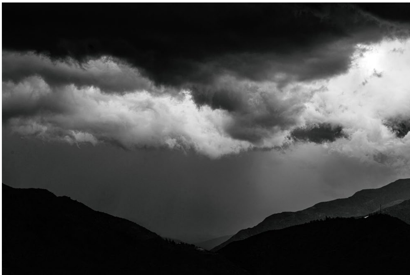
#9 | Santiago, 2021 | formato 45 x 30 cms | edición 7 + 2 A.P. firmada y numerada | impresión Fine Art sobre Hahnemühle Photo Rag ultra smooth 305 grs. 100% algodón | precio 80.000 CLP