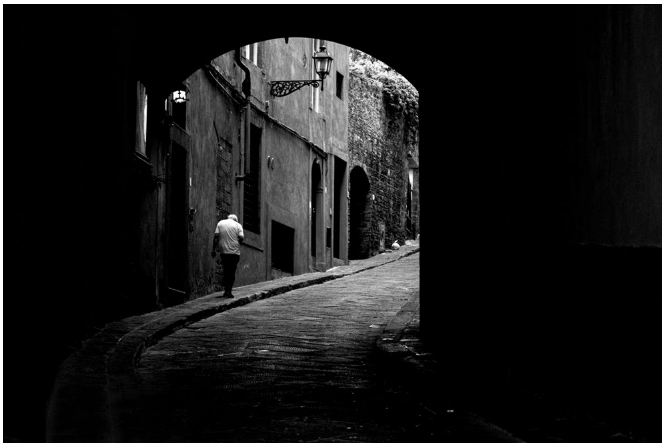
#8 | Florencia, 2023 | formato 45 x 30 cms | edición 7 + 2 A.P. firmada y numerada | impresión Fine Art sobre Hahnemühle Photo Rag ultra smooth 305 grs. 100% algodón | precio 80.000 CLP