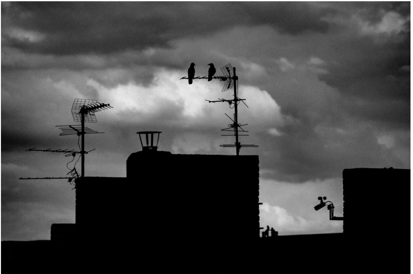
#6 | Berlin, 2020 | formato 45 x 30 cms | edición 7 + 2 A.P. firmada y numerada | impresión Fine Art sobre Hahnemühle Photo Rag ultra smooth 305 grs. 100% algodón | precio 80.000 CLP