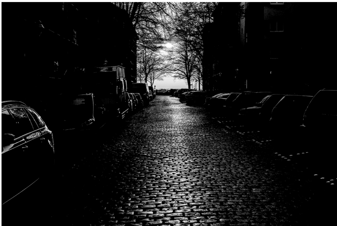
#10 | Berlin, 2020 | formato 45 x 30 cms | edición 7 + 2 A.P. firmada y numerada | impresión Fine Art sobre Hahnemühle Photo Rag ultra smooth 305 grs. 100% algodón | precio 80.000 CLP