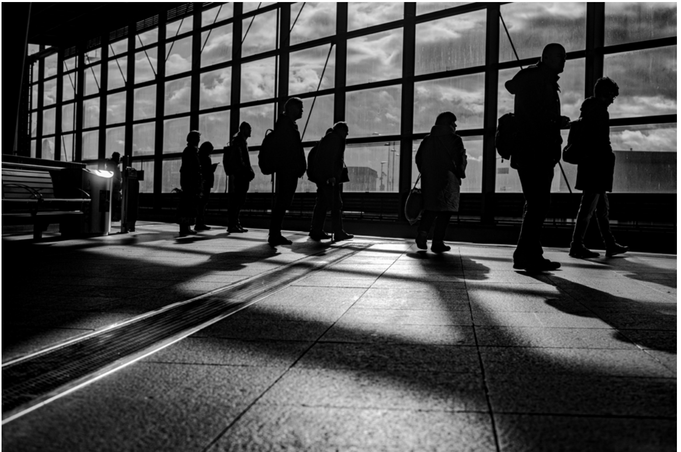
#14 | Berlin, 2023 | formato 45 x 30 cms | edición 7 + 2 A.P. firmada y numerada | impresión Fine Art sobre Hahnemühle Photo Rag ultra smooth 305 grs. 100% algodón | precio 80.000 CLP