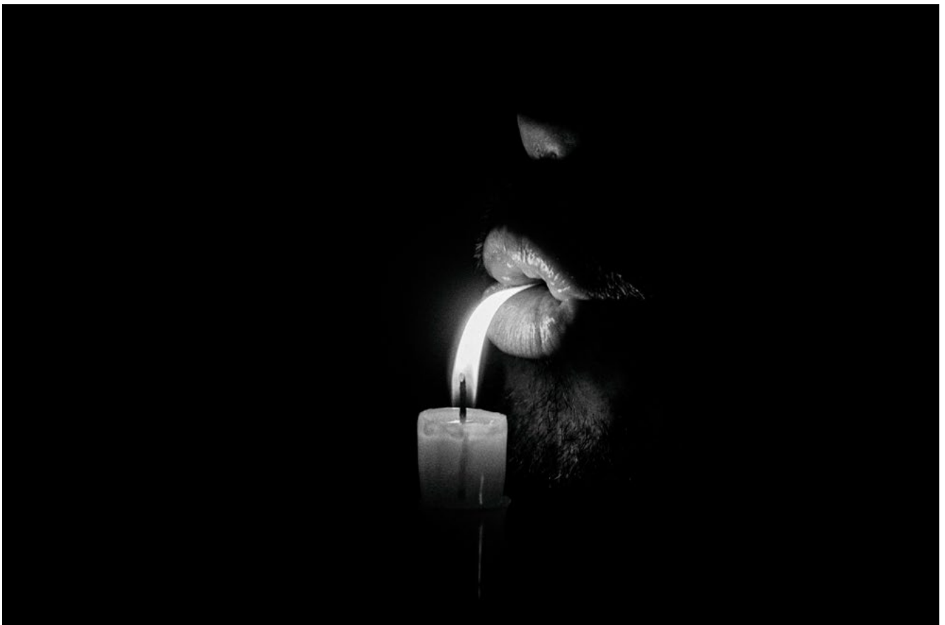
#5 | Berlin, 2018 | formato 45 x 30 cms | edición 7 + 2 A.P. firmada y numerada | impresión Fine Art sobre Hahnemühle Photo Rag ultra smooth 305 grs. 100% algodón | precio 80.000 CLP