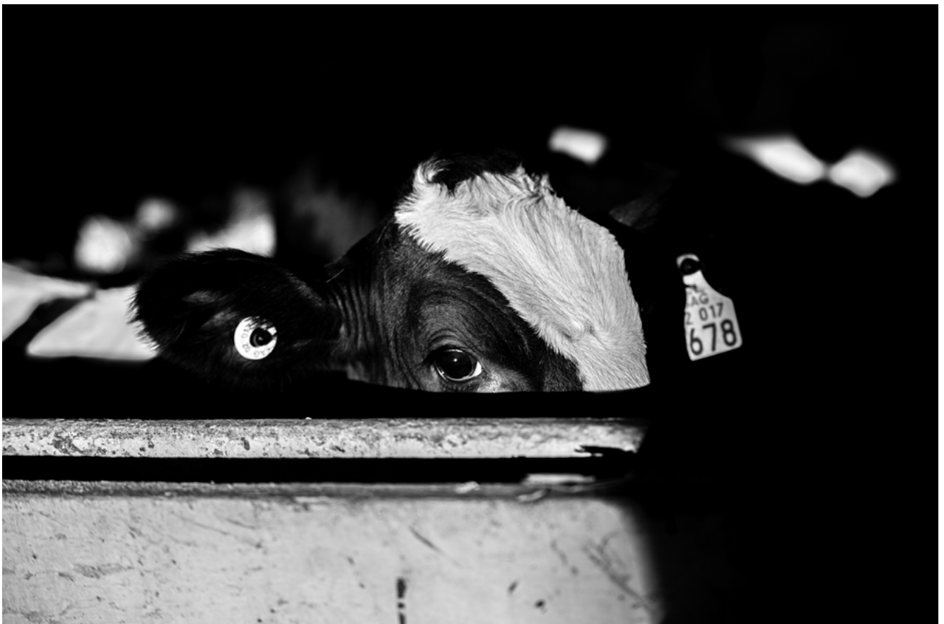
#13 | Chile, 2021 | formato 45 x 30 cms | edición 7 + 2 A.P. firmada y numerada | impresión Fine Art sobre Hahnemühle Photo Rag ultra smooth 305 grs. 100% algodón | precio 80.000 CLP